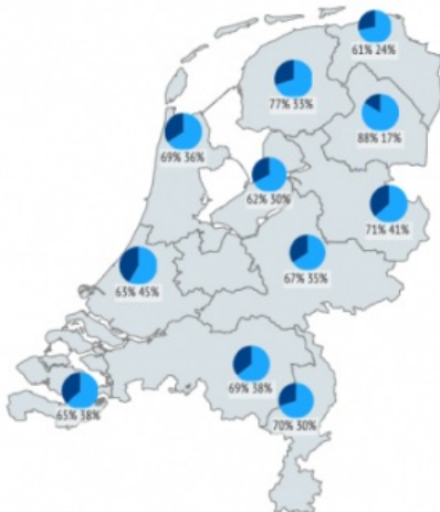
Digitale toegankelijkheid museumcollecties per provincie 2018

■ Collectie gedigitaliseerd ■ Collectie via internet toegankelijk