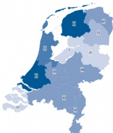
Totaal aantal beschermden stads- en dorpsgezichten per provincie - 2018