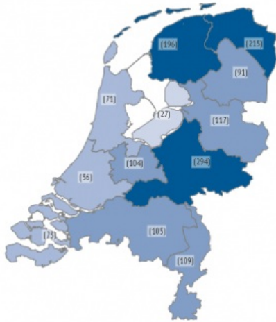
Aantal archeologische rijksmonumenten per provincie 31-12-2018