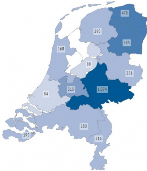
Aantal archeologische complexen per provincie - 2015

< 150 150 < 300 300 < 450 450 < 600 >= 600