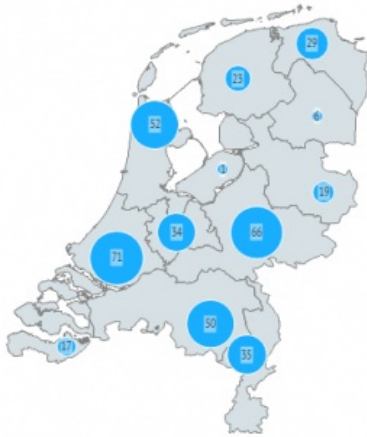
Adviesverzoeken WABO per provincie - 2018