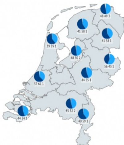
Locatie objecten musea per provincie - 2018

■ In eigen museum ■ In depot ■ Bruikeleen in het binnenland