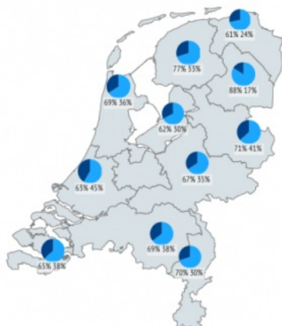
Digitale toegankelijkheid museumcollecties per provincie 2018

■ Collectie gedigitaliseerd ■ Collectie via internet toegankelijk