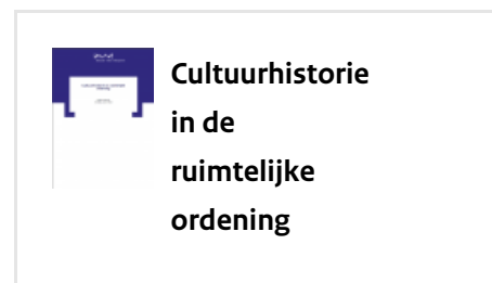
Cultuurhistorische waarden in de verbeelding - 2016